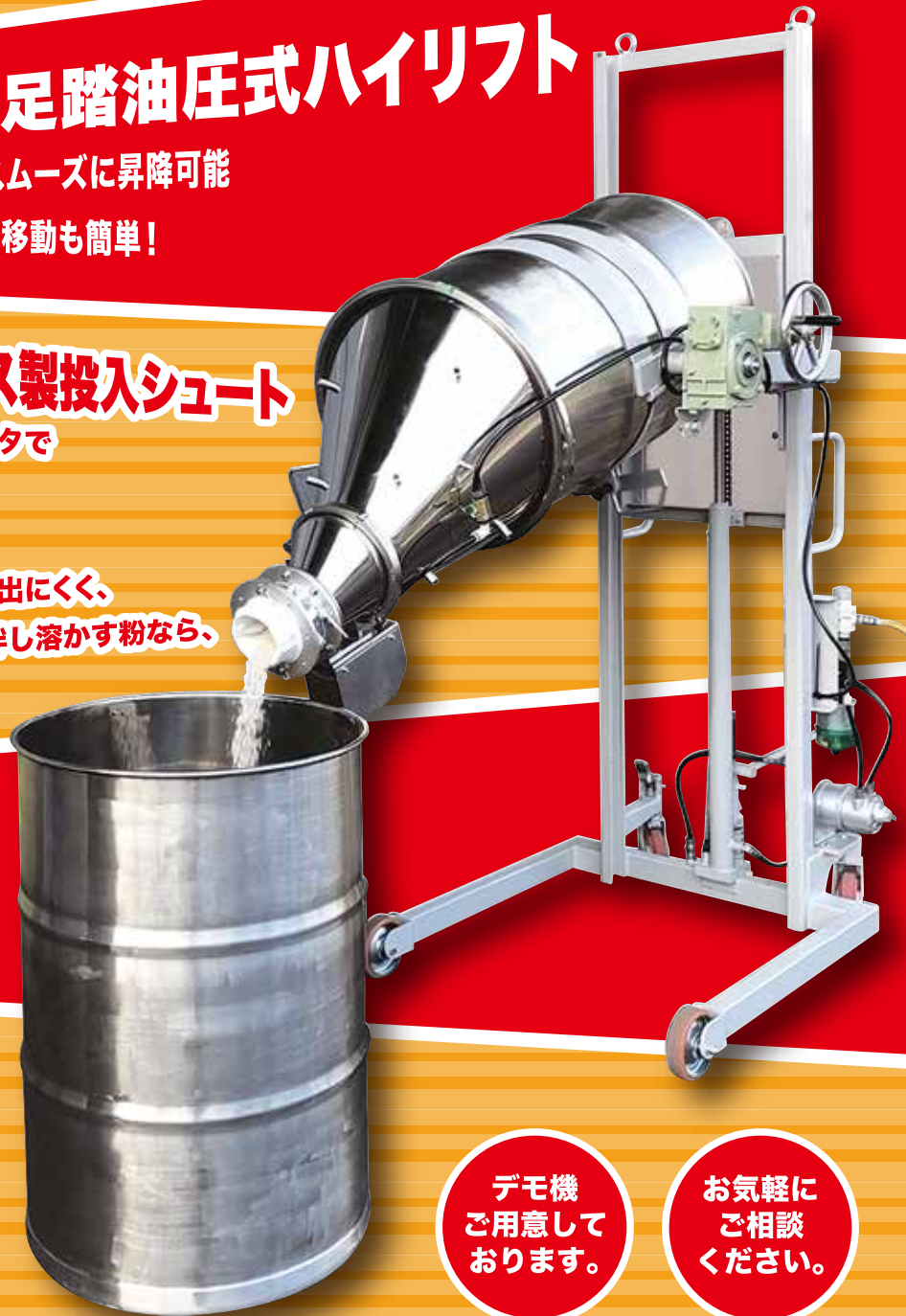
粉体投入仕様ハイリフト1500